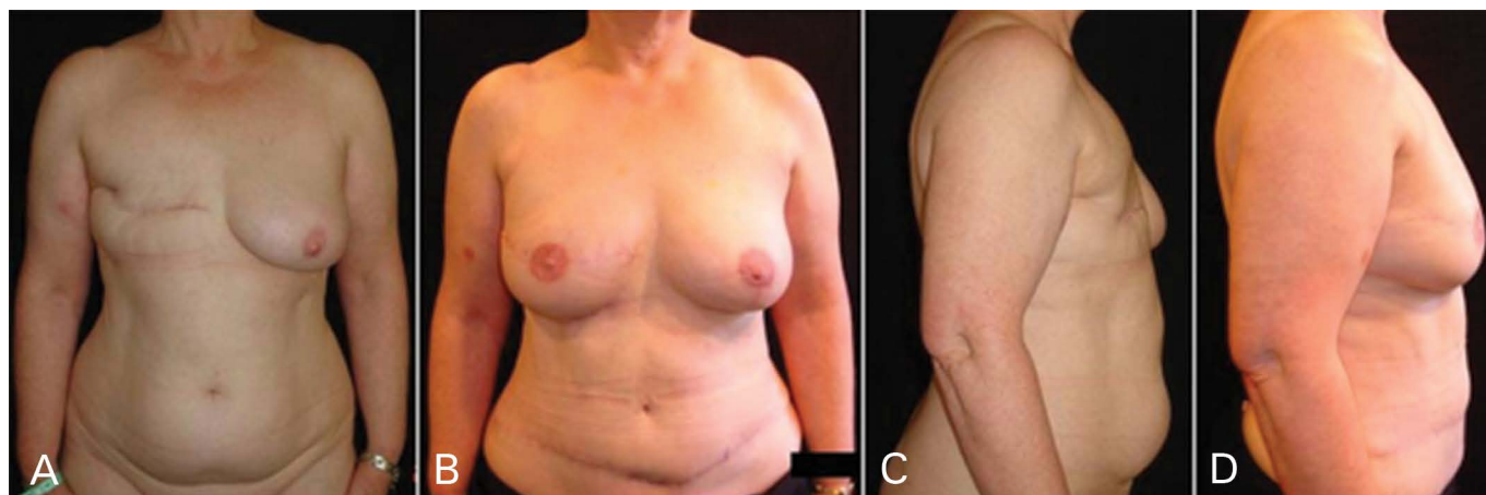
Figura 3. Caso de reconstrução tardia com retalho TRAM desepitelizado em mama irradiada e mastectomia contralateral. (A) imagem pré-operatória. (B), (D) imagem pós-operatória aos 5 anos de seguimento mostrando a proporção da expansão da pele da mama sem necessidade de expansores além de melhora na qualidade da pele.