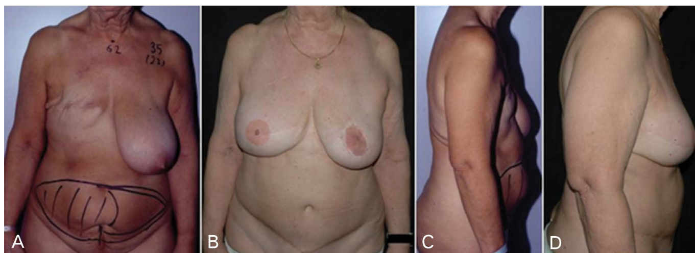
Figura 4. Caso de reconstrução tardia com retalho TRAM desepitelizado em mama irradiada e mastectomia contralateral. (A) imagem pré-operatória. (B), (D) imagem pós-operatória aos 6 anos de seguimento mostrando a proporção da expansão da pele e aparência natural da mama.